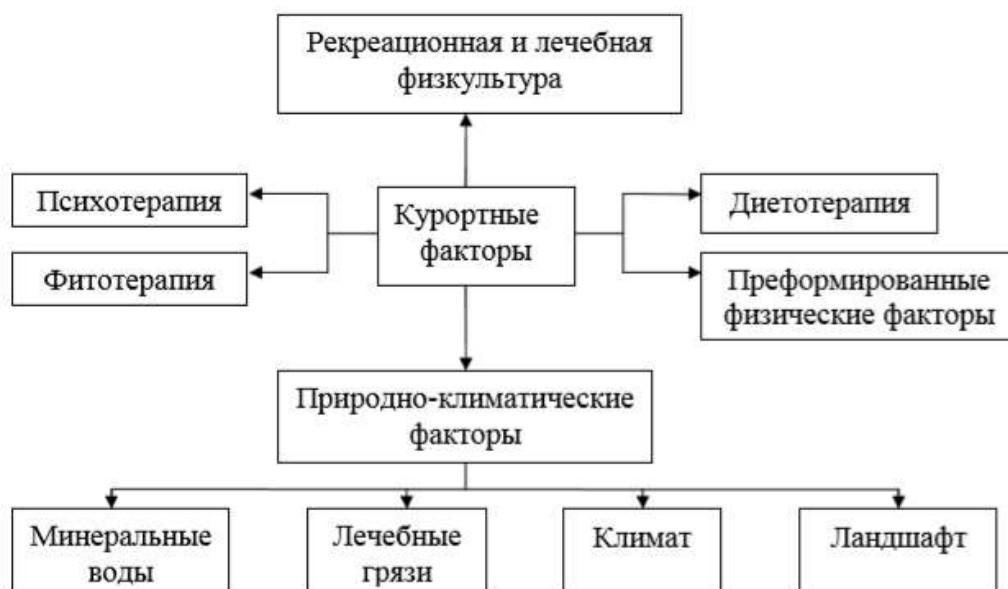
Рисунок 1 – Курортные факторы и их использование в лечебных и оздоровительных целях

Таблица или рисунок в тексте должны занимать не более одной страницы. Если аналитическая таблица или рисунок превышают одну страницу, их следует включать в Приложения.